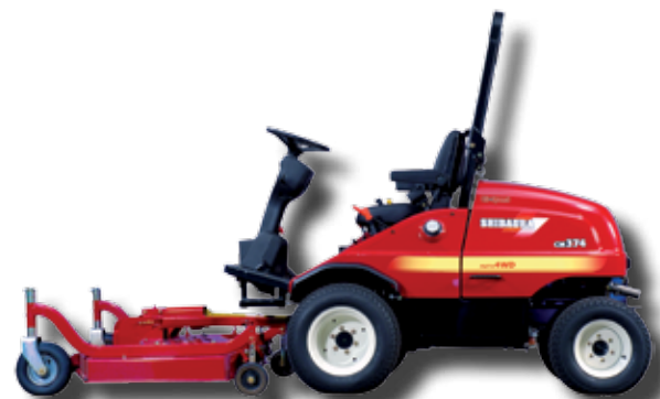
CM374 (37 CV)