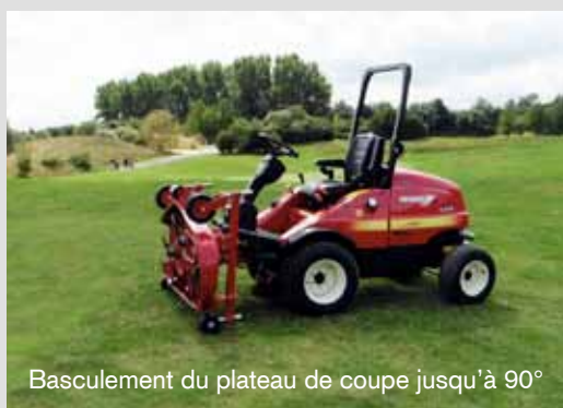
Basculement du plateau de coupe jusqu'à 90°