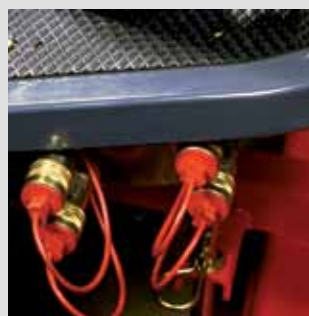
Connexions hydrauliques avant pour accessoires CM 314 & 374