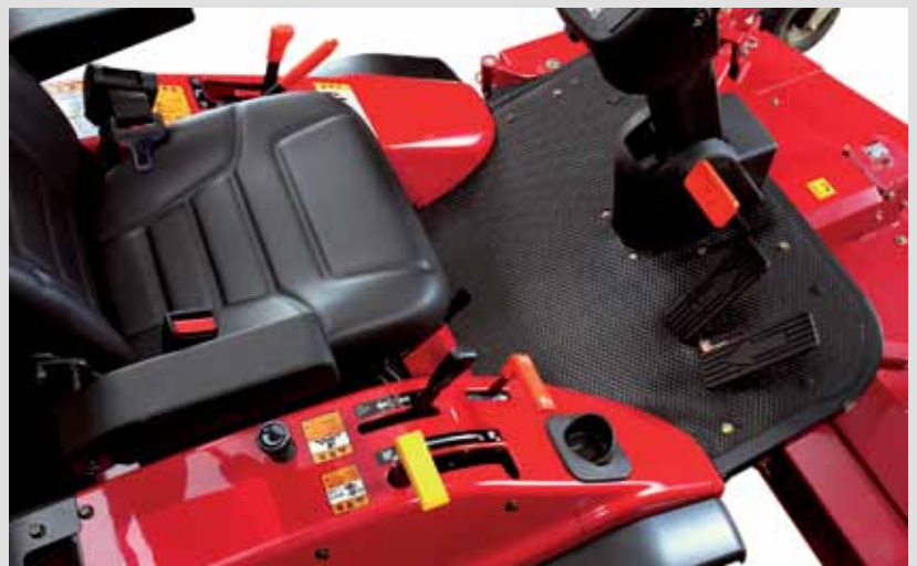
Poste de conduite CM314 / 374