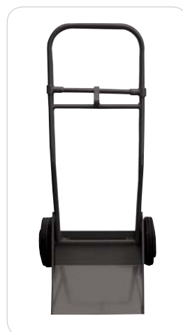
Chariot de transport en option