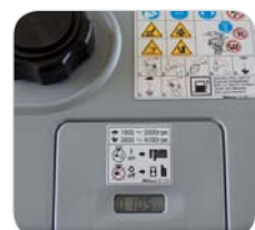
Compteur d'heures et vibrations