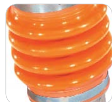
Soufflet en polyéthylène avec bornes anti-rotation