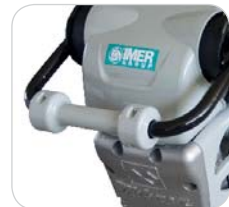
Poignée ergonomique avec barre de roulement