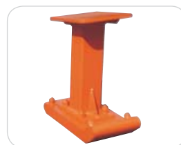
Réhausse de pilonneuse avec pied étroit en option L 165 x H 340 (MTX 70)