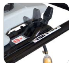
Levier de commande